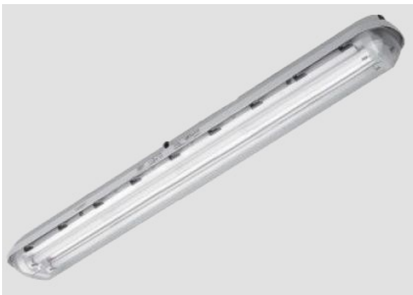
Luminária para atmosferas explosivas para uso normal ou emergência